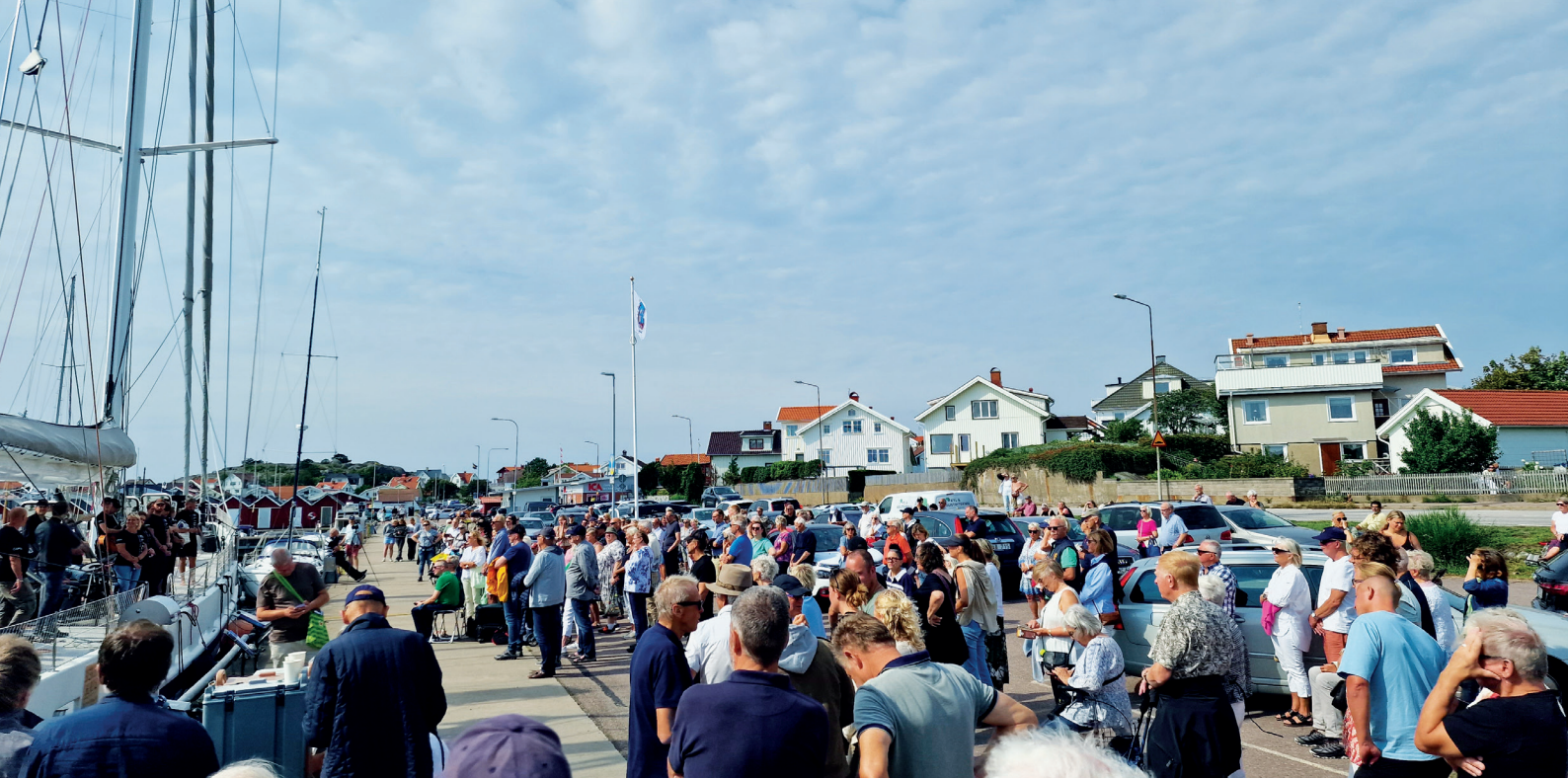
Folksamling i Klåva hamn när Elida avreser till Israel.