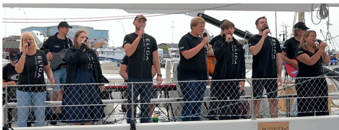
... liksom Elidas musikteam.